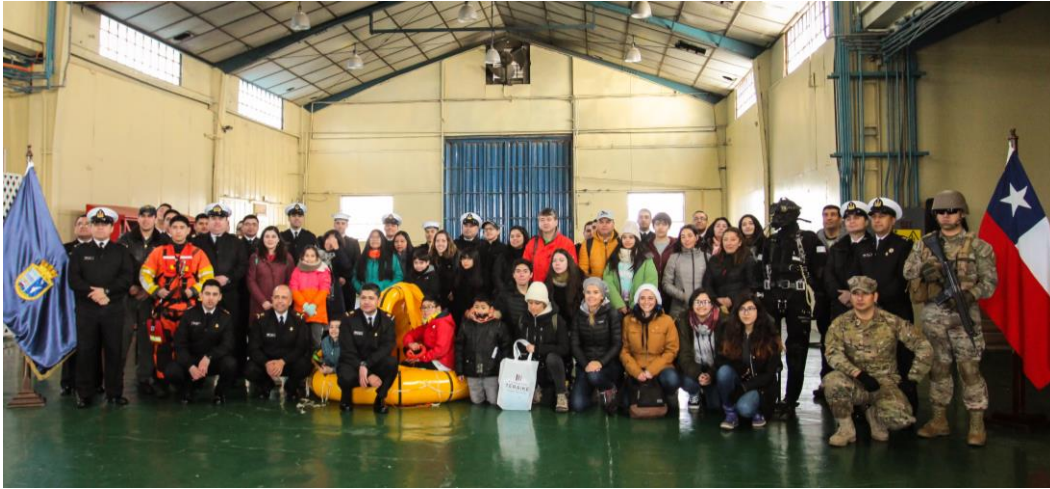
Premio Armada de Chile