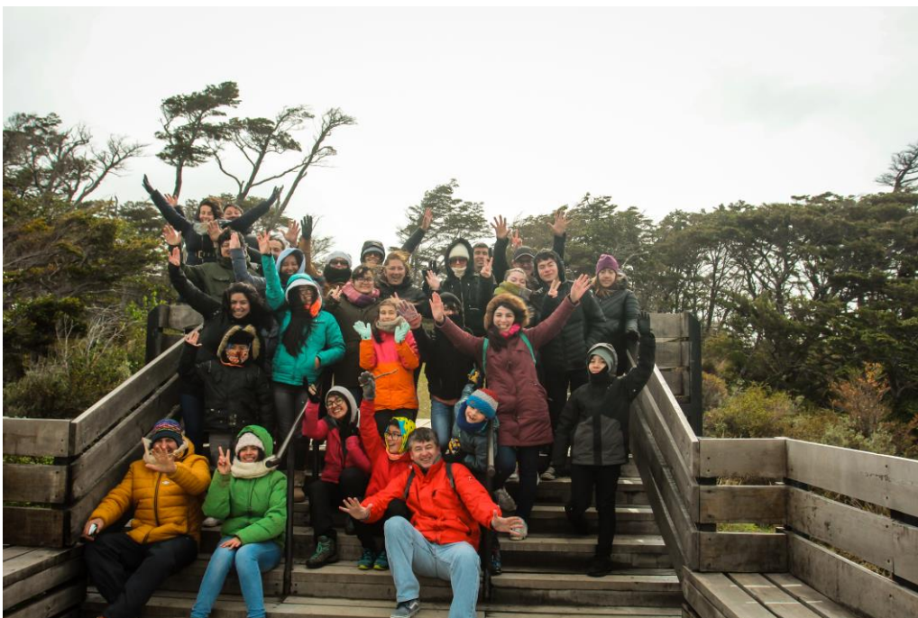
Premio Parque del Estrecho